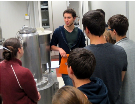
Bild: Praktikant aus New Jersey, USA, präsentiert seinen Arbeitsbereich im Labor