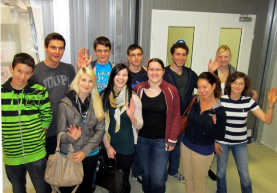
Bild: PraktikantInnen am RCPE